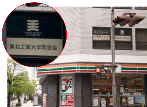
南町通り側に同窓会の看板を設置

これまで550回を超える企画展示や講演・講座を開催してきましたが、今後も「東北工業大学の“まちなか”の拠点」として多くの方々に利用していただけますよう期待します。仙台市地下鉄東西線 青葉通一番町駅から徒歩約3分。是非、足をお運びください。