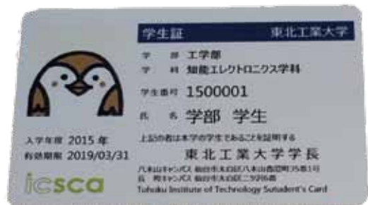
イクスカ付学生証

また、平成 28 年 4 月入学の新入生から学生証を仙台市交通局の IC カード乗車券「icsca（イクスカ）」に切り替えました。この icsca 導入にあたり発行の一部を同窓会が援助しています。icsca 付き学生証は導入第 1 号として仙台市の WEB でも紹介されています。学生証は従来通り授業の出欠管理や図書館の書籍の貸し出しにも対応していて、今回の IC カード機能が加わることで通学からキャンパスライフまでこの学生証 1 枚で快適に過ごせるようになりました。