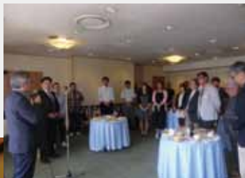
28.6.5 新潟支部支部総会 後援会合同懇親会

設立 20 周年を迎える記念祝賀会に、この「いい人間をめざせ」の具現化目指し和・輪・環・を以って盛大な集いとし、新たなネットワークの構築と更なり母校の発展に繋がるよう期待いたし、支部活動報告とします。