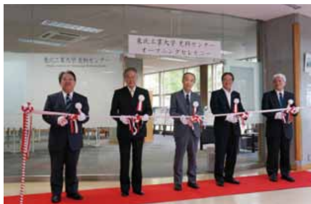
史料センターオープンセレモニー

今後とも教職員がひとつになって教育、研究、そして社会貢献という大学の使命を果たしてまいります。東北工業大学同窓会の皆さまにはこれまで同様のご支援をお願いします。