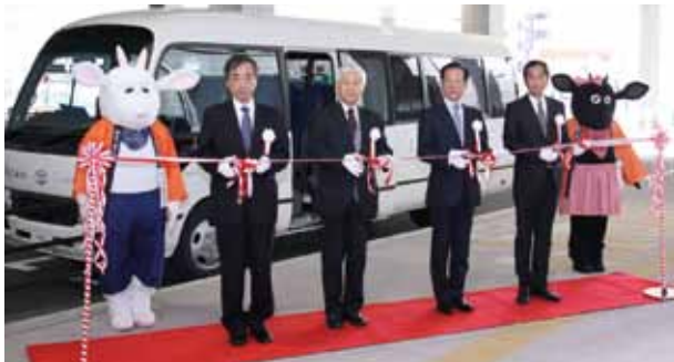
シャトルバス運行開始セレモニー

平成 27 年 12 月 6 日（日）に「八木山動物公園駅」のある仙台市地下鉄東西線が開通し、東北工業大学への交通利便性が高まりました。これにともない「八木山動物公園駅」と八木山キャンパス、長町キャンパスをつなぐ無料シャトルバス「八木山シャトル」が運行され、翌 12 月 7 日（月）に運行開始テープカットセレモニーが行われました。本学キャラクター「もちろう」「あんこ」も参加し開通をお祝いしました。