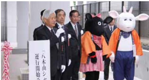
宮城前学長の挨拶