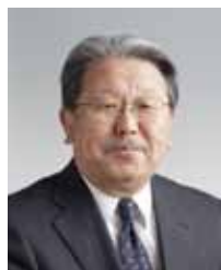
東北工業大学 学長

本学開学後の四半世紀は「昭和の後半」の時代で、科学技術の発達とともに高度成長期があり、その流れにのって着実に自立への道を進んできました。後の四半世紀は「平成」とともに歩み、バブル経済後の不況で日本でも「失われた10年」といわれた時代でしたが、しっか