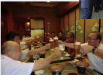
28.7.30 同窓会新潟支部 20 周年祝う会準備会