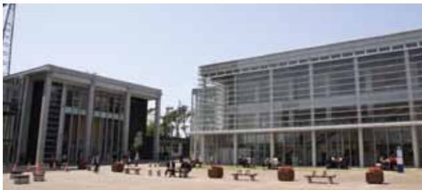
ベンチを設置した八木山キャンパス

さて社会が不透明感を増す中であって、国はいま教育システムの抜本的な改革を強力に推し進めており、大学の教育改革はその中心課題とされています。少子化が急速に進む中で学生獲得競争に勝ち抜いていくためには、将来を見据えた教育改革を迅速に進めていく必要があります。私大に強く求められているのは教育のオリジナリティーであり、またそこで掲げる教育目標の達成と、その効果に対する説明責任としての客観的な評価体制の整備など教育システムの変革です。このような現状にあって、同窓会の皆様には本学の人材育成に積極的に関わっていただき、教育の一翼を担っていただくことを望みます。すなわち、本学卒業生にはどのような資質が求められるのか、そのためには何をどこまで、何に重心を置きつつ教育すべきかなど、本学OB・OGとして、また卒業生を受け入れる社会の側の立場として、工大が実践すべき教育のありかたについてご助言をいただきたいと思っております。教育は大学の中だけで閉じたものではなく、本学を支えていただく多くの皆さんとともに作り上げていくべきものであると考えます。迫り来る教育改革の荒波の中にあって、同窓会の皆さんに寄せる期待はこれまでも増して大きくなっているという現状をご理解いただくと幸いです。どうぞよろしくごお願い申し上げます。