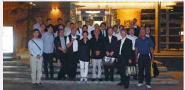
写真は前回のサッポロビール園にて

また、『支部だより』については、パソコン等の環境下でない方もいらっしゃると思いますので、毎年一回は発行して行く予定であります。