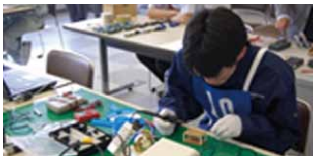
「高校生ものづくりコンテスト」の電子回路組立部門に取り組んでいる生徒

今後の技術者に求められることは、問題を解決する能力と発見する能力いわゆるPDCAサイクルをあらかじめ実習などとおして十分学んで身につけ、さらに自分なりの感性をものづくりに活かし磨くことで自分や他人を感動させられるものづくりにつなげられるよう努めてほしいものです。