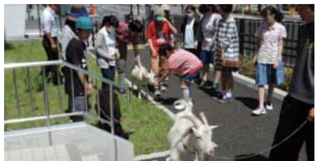
長町キャンパスにはヤギの親子も仲間として活躍中です(出前ヤギ:八木山市民センターにて)。

現在の長町キャンパスは、本学が昭和62年に二つ沢校地として取得し、平成2年に1、2年生を対象とした教養教育や体育施設を中心とした「二つ沢キャンパス」として開設されたことから始まります。平成20年4月には、本学の固いイメージを払拭し、これからの社会が求められるであろう、文理融合型の新たな学部が不可欠のことから、クリエイティブデザイン学科(CD学科)・安全安心生活デザイン学科(SD学科)・経営コミュニケーション学科(MC学科)の3学科を持つライフデザイン学部(学部生定員220人)を開設しました。尚、CD学科とSD学科は、工学部のデザイン工学科を背景とし、新たな要素を付加しつつ継承した形となっております。開設から今年で9年目を迎えておりますが、開設時は3学科のそれぞれの特徴を活かし有機的な繋がりある姿を、如何に社会に知っていただくかが課題でありました。3学科の関係をわかりやすく言えば、作り手(CD学科)・使い手(SD学科)・つなぎ手(MC学科)のそれぞれの立場で教育研究を行い、実社会で通用する人材育成を目指すことです。東日本大震災以降では、各学科で取り組んだ復興支援の、学生・教員との協働によるプロジェクト実践が多く見られましたが、地域社会での実践は学生の高い就職率に繋がることは確かであり、特に卒業生在籍の企業との繋がりも増すことにもなります。今後は、これまで以上に卒業生と繋がり(在学生へのセミナーの講話、インターンシップ等)を強化し、出口に強い学部であることを社会にアピールしたいと考えております。本同窓会と学部との実践的な連携事業を増やすことは不可決であり、同窓会とつくるライフデザイン学部をキャッチフレーズにするスローガンを打ち出したいとも考えております。今後ともご協力の程、宜しくごお願い申し上げます。